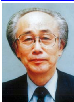
経済評論家 内橋 克人 (うちはし かつと)

1932年神戸市生まれ。新聞記者を経て経済評論家。 NHKラジオ「ビジネス展望」などのレギュラーをはじめ、テレビ、新聞、雑誌などのメディアを舞台に、活発な発言・執筆活動を続けている。 2006年、宮沢賢治学会 イーハートブ賞を受賞。