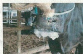
口蹄疫に感染した牛

Infected cow with FMD