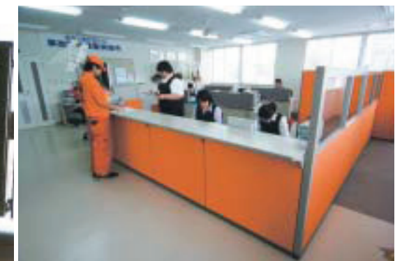
鹿児島支店事務所