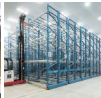
冷凍・チルド庫内。最新の環境型冷蔵設備を採用している