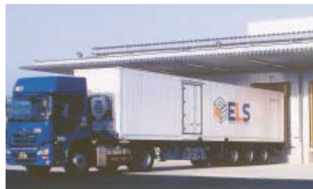
ブルーがシンボルのトラックと鹿児島物流センター