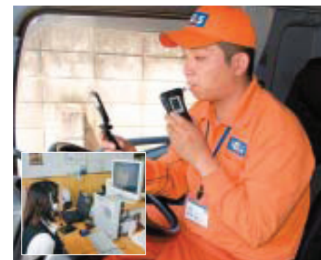
携帯電話を利用したアルコールチェックシステム