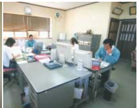
本 社 事 務 所