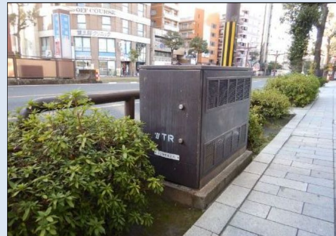
地上機器のイメージ